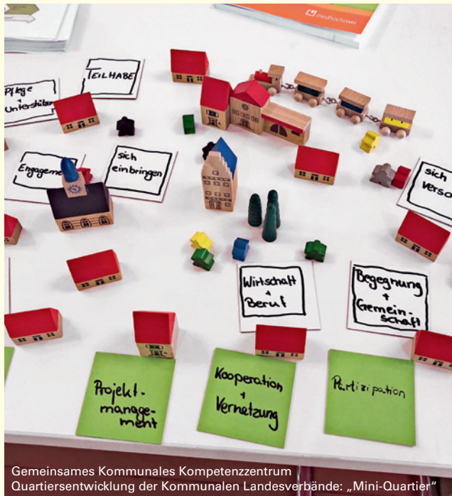
Gemeinsames Kommunales Kompetenzzentrum Quartiersentwicklung der Kommunalen Landesverbände: „Mini-Quartier“

Der Aktiv-Markt lebt von Ihrer Beteiligung! Nutzen Sie also die Gelegenheit und treten mit anderen Teilnehmenden, Ausstellern und weiteren an der Quartiersarbeit beteiligten Akteuren ins Gespräch.