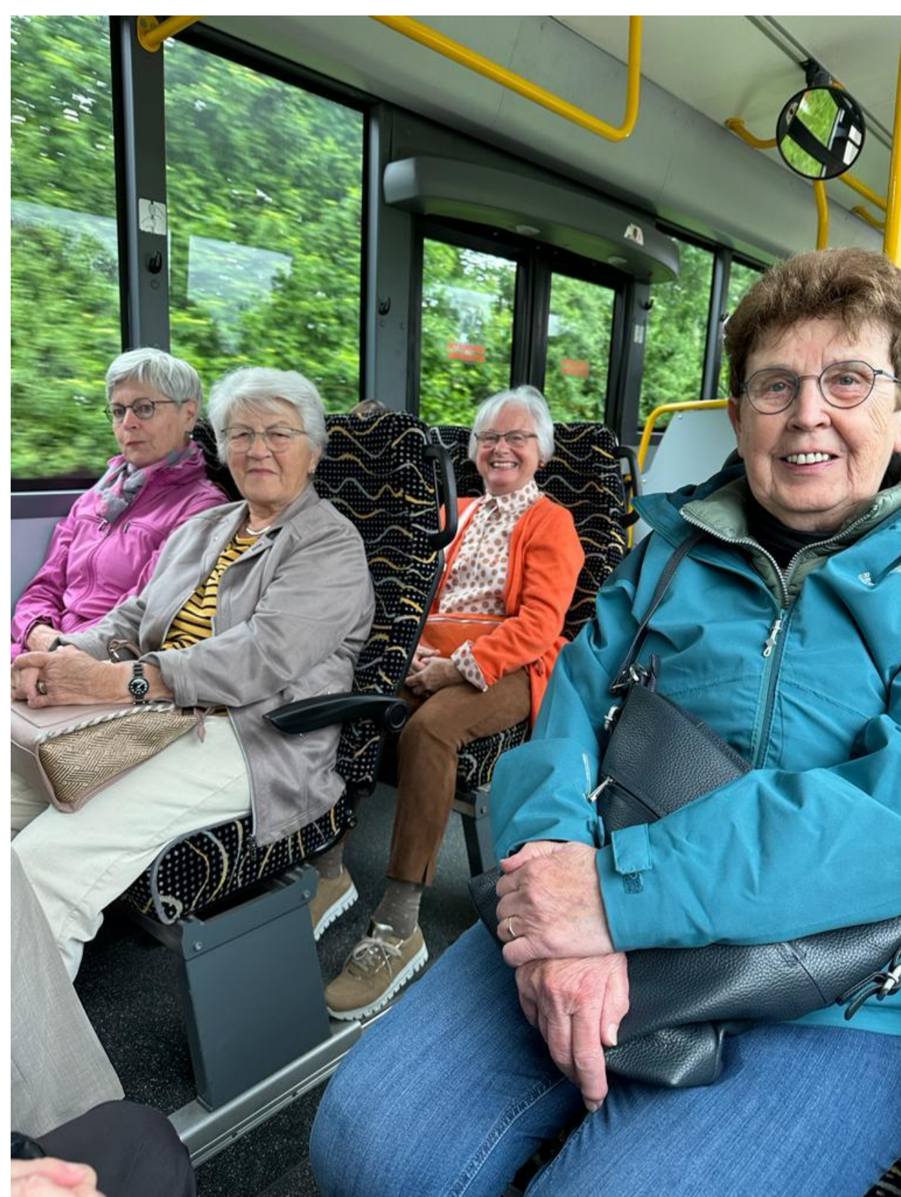
Bild 3+4: Nebenbei werden die Nutzung der Öffentlichen Verkehrsmittel und der Orientierungssinn trainiert.