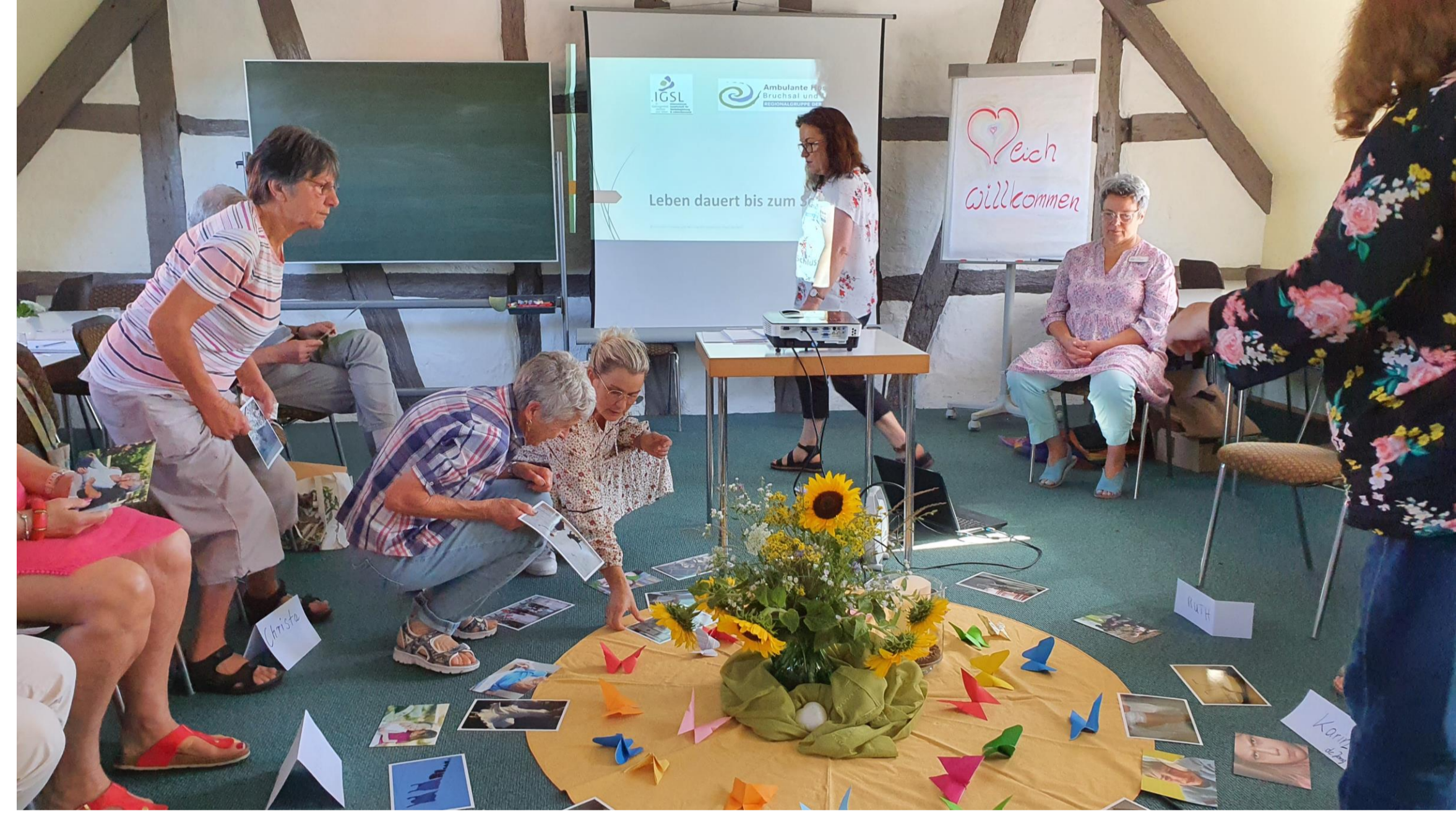
Bild 3: Schulung im Rahmen des Kurses der Nachbarschaftshelfer und –helferinnen im Saal des alten Rathauses Stutensee.

Im Sommer 2022 wurde für Interessierte an der Mitarbeit in der Nachbarschaftshilfe ein Kursangebot über acht Abendveranstaltungen und zwei Samstage organisiert. Die Teilnehmenden erfuhren durch kompetente Referent/innen wichtige Aspekte für ihren Einsatz.