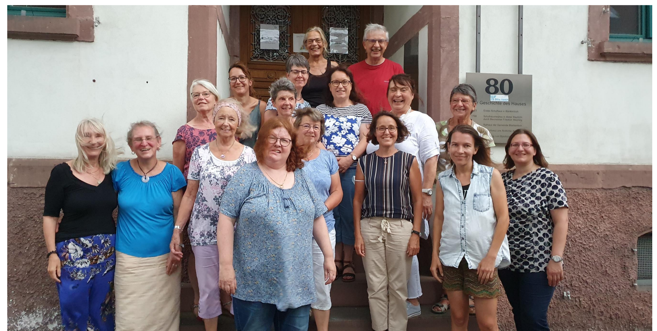
Bild 4: Kurs der Nachbarschaftshelfer und Nachbarschaftshelferinnen Sommer 2022

Über mehr als 30 Unterrichtseinheiten verfolgten die Kursteilnehmenden die Schulungsangebote des Quartiersmanagements. Am Abschlussabend durften die neuen Nachbarschaftshelfer/innen in einer feierlichen Abschlussrunde ihr Zertifikat als Nachbarschaftshelfer/in entgegennehmen.