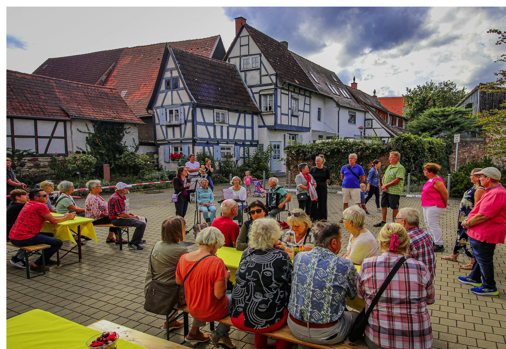
Bild 5: Tag der offenen Tür und Feier des Umzugs ins neue Quartiersbüro am 19. September 2023

Bei strahlendem Spätsommerwetter durften die Mitbürger zu Gast im Alten Rathaus, dem neuen Quartiersbüro, sein. Zahlreiche Ehrenamtliche trugen zu einem strahlenden und frohen Fest bei. Ehrenamtliche halfen beim Aufbau und beim Abbau der Tische und Bänke und beim großen Aufräumen. Große Freude bereitete die musikalische Unterhaltung durch Gitarrenbegleitung, Flöte und Akkordeon durch ehrenamtliche Musizierende.